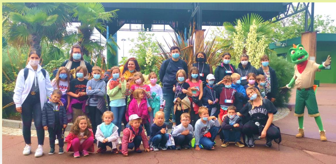
Sortie à Wallygator