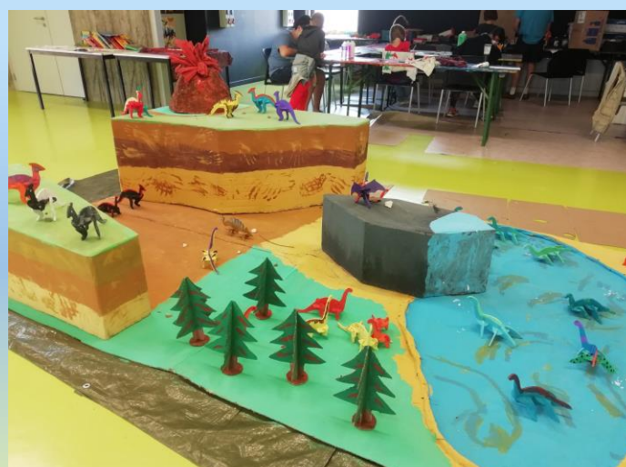
Création de la vallée des dinosaures

Avec une équipe d'encadrement dynamique, composée de personnels du FEP et de personnels mis à disposition par la municipalité, ils ont pu participer à des activités très diverses et adaptées à chaque tranche d'âge sur 2 thèmes : « du créacé à la préhistoire » et « Mario contre Pokémon ».