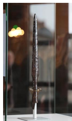
La lance d'apparat découverte lors des fouilles archéologiques de Cutry